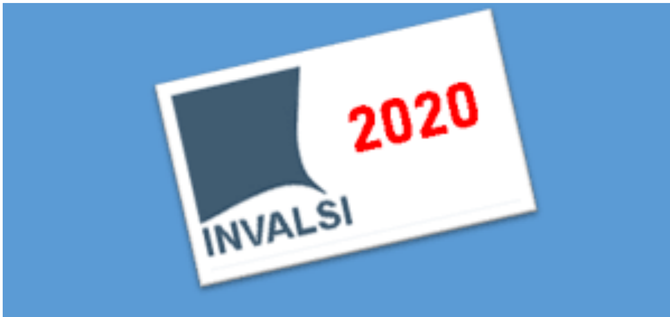
Prova invalsi 2020